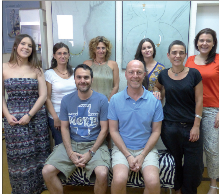
Grupo del curso de Diamante del HRD de Junio de 2014.

Y no solamente los pequeños, sino también los adultos nos planteamos empezar estas asignaturas pendientes desde hace tiempo y retomar los estudios, interrumpidos o aparcados por motivos múltiples. La época de crisis con las exigencias en el trabajo más pausadas y tranquilas nos lleva a pensar en ofrecer nuevos servicios a los clientes y para ello necesitaríamos profundizar en nuestros estudios y/o simplemente ampliar nuestros conocimientos actuales. Por este motivo A.E.T.A. ofrece a todos los profesionales del sector su enseñanza personalizada y pensada específicamente en las necesidades del día a día de la joyería. Por orden cronológico le recordamos todas las opciones 2014/15. Para más información por mail o teléfono 91-5596866.