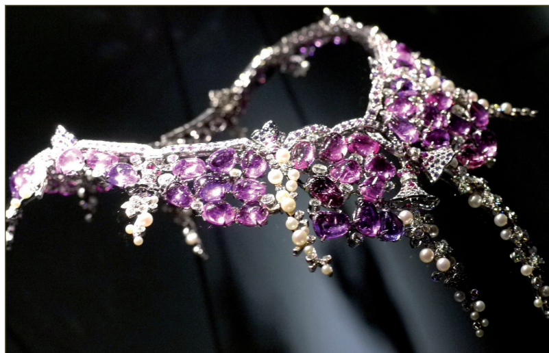
Una de las fabulosas piezas de Van Cleef & Arpels expuestas en la muestra de París.

Cada época tenía, además de la vitrina principal, una mesa vitrina redonda dónde se presentaban objetos de colección, accesorios de indumentaria, cajas y otros objetos de Vertu. Unos paneles