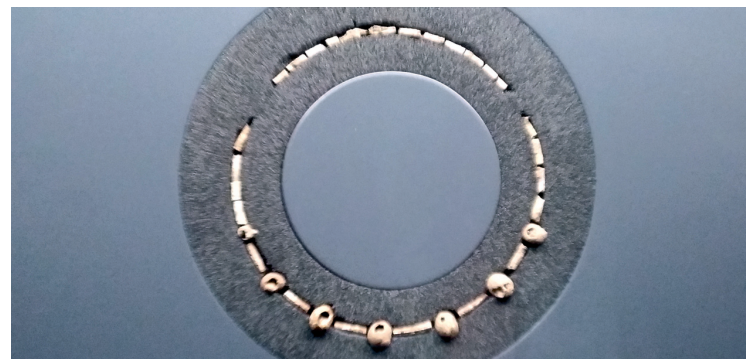
Un collar casi entero paleolítico expuesto en el MUPAC de Santander