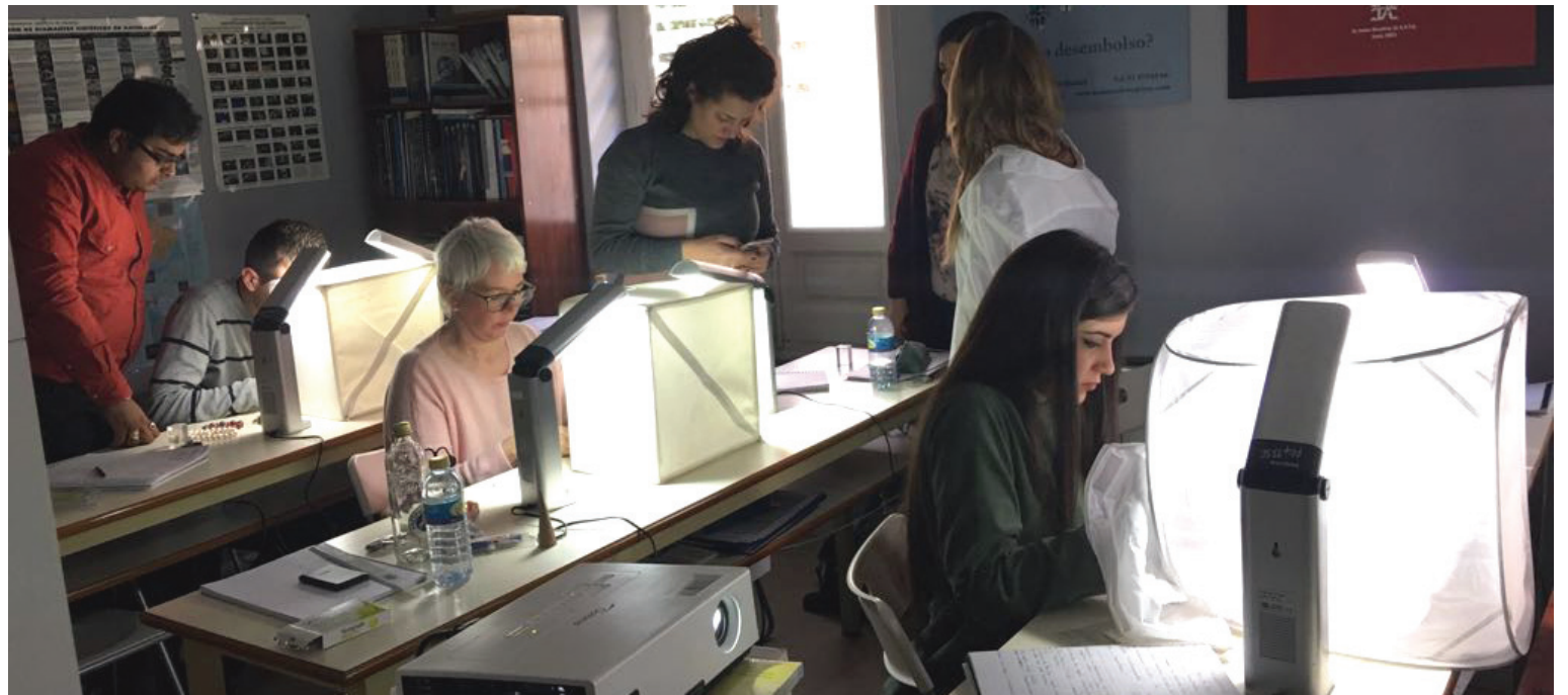
Curso de fotografía de joyas impartido por AETA para subirlas en óptimas condiciones a las carpetas de tasaciones online.

El otro día estaba leyendo en este mismo Periódico la entrevista con Gemma López del JORGC, un alegato en defensa de la propiedad intelectual, donde pide un NO rotundo a las copias en defensa del creador y pequeño artesano.