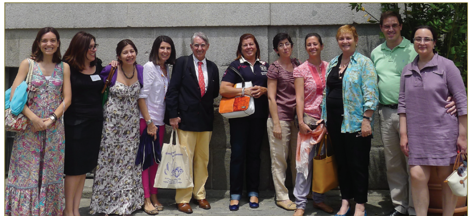
Los alumnos y socios de AETA durante su visita al museo madrileño.

Daniel Alcouffe. Botín de guerra de las tropas francesas en 1813, las alhajas son devueltas dos años después, a pesar de que algunas de ellas sufrirán pérdidas y mutilaciones. Casi un siglo más tarde, su valor crematístico vuelve a lastrarse, cuando un empleado del Museo sustrajo algunos vasos, así como detalles de los mismos o guarniciones. Sin embar-