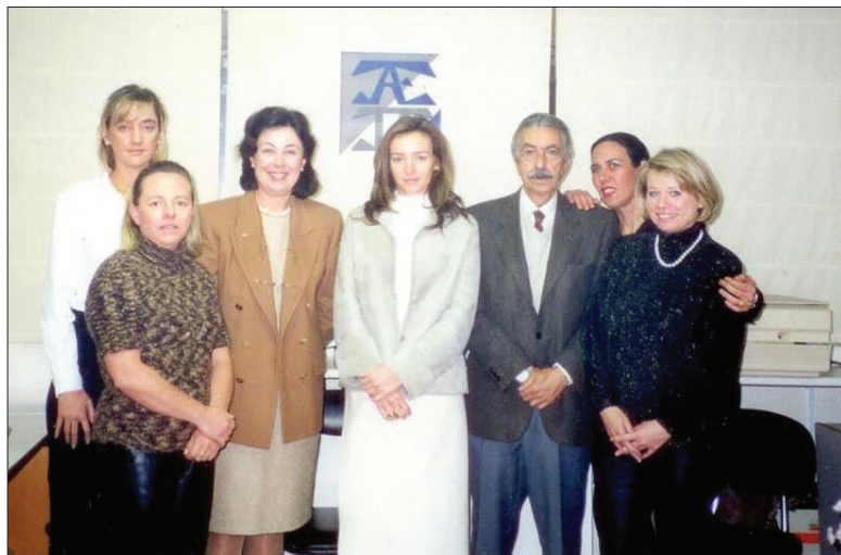
Componentes de la primera junta de AETA