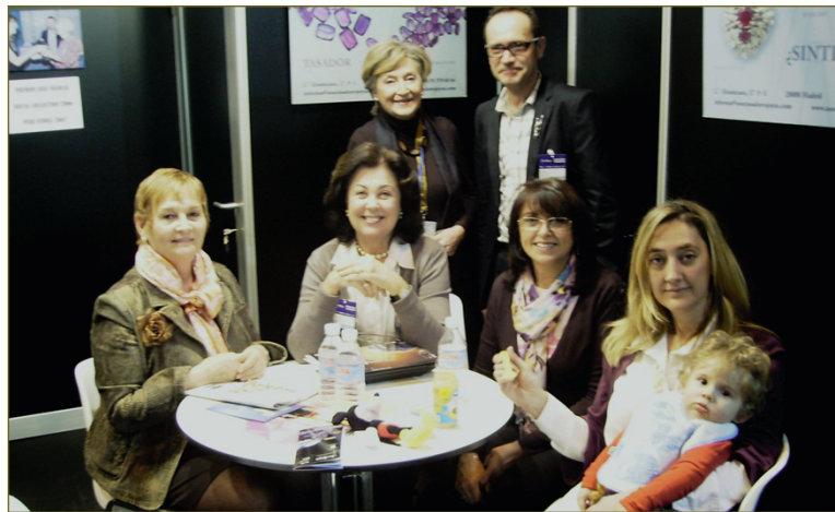
Nuestro stand en la feria de Iberjoya sirvió también como punto de encuentro para los socios, incluyendo una nueva generación

En breve empezaremos a comunicar los primeros pasos y actividades de A.C.A.J.A.