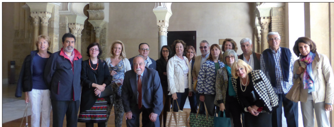
El grupo en la entrada del Palacio de la Aljafería.