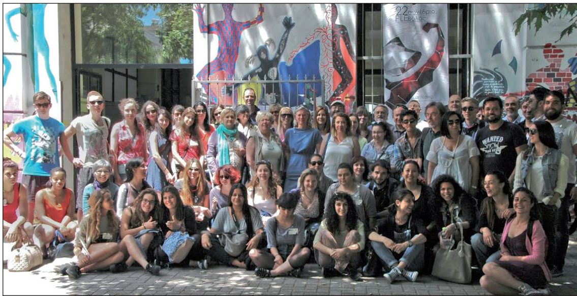
Foto de 'familia' de los alumnos y profesores asistentes a la XXII Edición del PLE, celebrada en Grecia.

Grecia, República Checa, Eslovenia, Portugal y España, presentaron para el concurso convocado magníficas piezas de joyería y los diseños de las piezas realizadas. La exposición de las piezas del concurso, así como la colección itinerante de joyas, se hizo en un entorno singular como fue el Museo N & S Tsalapatas o Museo del Ladrillo, Pudimos asistir a varias conferencias, donde aprendimos sobre la historia de Volos y mitología griega, diseño de joyas y una revisión al mundo del diamante, terminamos con un