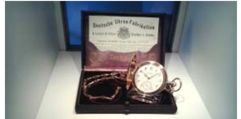
Una de las piezas expuestas en el Museo de A. Lange & Soehne.

Debemos mencionar el Museo de la ciudad y minero , donde se explica la historia de la minería de la zona. Después podemos visitar en la misma Escuela técnica su colección mineralógica con una rica muestra de minerales, rocas, carbones y fósiles. Y ciñéndonos a la parte que nos interesa como Gemólogos, en el Castillo-Palacio Freudenstein , no solamente encontramos los "archivos mineros" si no también la sede de Terra Mineralia , grandiosa exposición de minerales y gemas, que hoy en día pertenecen a la Universidad de Freiberg. Naturalmente existe también la posibilidad de visitar diversas minas con sus galerías, sus instalaciones del transporte y sus edificios de servicios y descanso originales. En fin, el que quiera se puede sumergir en el