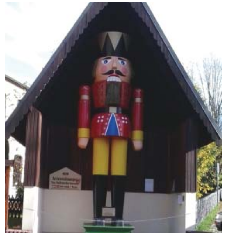
Talla en madera con traje típico de los mineros.

mundo minero de los siglos pasados o volver a la superficie y disfrutar de los otros tesoros artísticos y gastronómicos de esta hermosa parte de Europa, todavía un tanto desconocida para el turismo organizado.