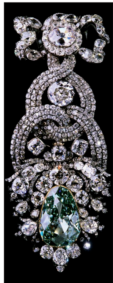
El diamante verde de Dresde tiene 41 quilates y pasa por ser el mayor del mundo en su especie.