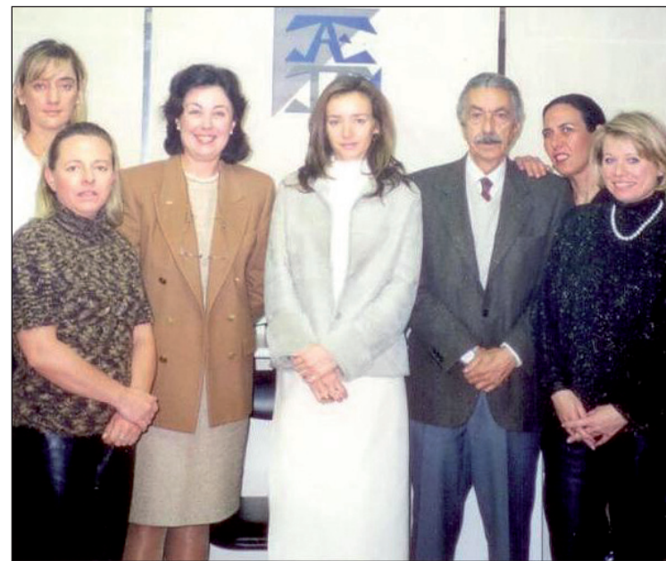
Foto de 'familia' de una de las primeras Juntas Directivas de la Asociación Española de Tasadores de Alhajas.

Desde nuestra mayoría de edad como Asociación, los componentes sénior nos acordamos con cariño del trabajo compartido durante los primeros años en la