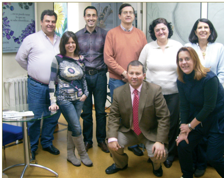
Instantánea de los alumnos con su profesora de Historia del Arte de la Joyería